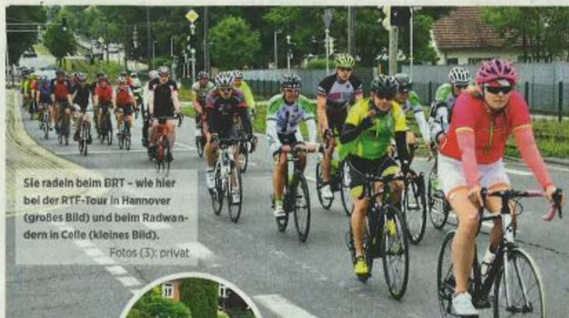
Sie radeln beim BRT - wie hier bei der RTF-Tour in Hannover (großes Bild) und beim Radwandern in Celle (kleines Bild).

Radfahrer aus ganz Deutschland versammeln sich zum Bundes-Radsport-Treffen (BRT)